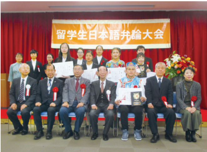
審査員として、日向社会貢献委員長が参加 八幡法人会賞を日向委員長より受賞者へお渡ししました。