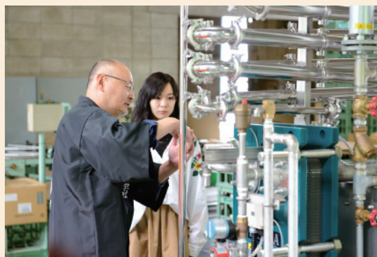
設備は洗いやすく、清潔に保てるシンプルな物を使っています。