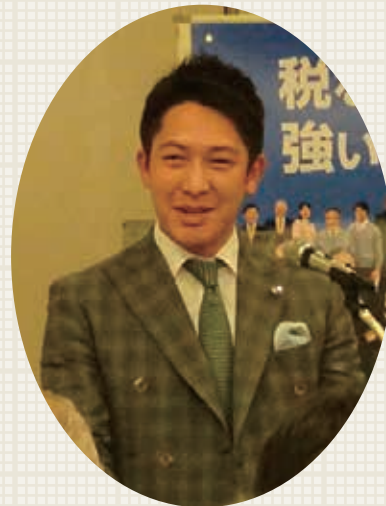
司会者 福田青年部会副部会長