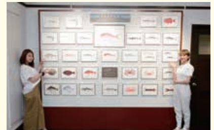
日本水産魚譜の美しさに感激です！

その後、「ちくわ」や「フィッシュソーセージ」を開発し、最近では「焼きおにぎり」も生産しています。