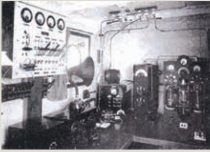
大正時代のトロール船の無線室

1930年代、ニッスイのトロール漁船は、漁業無線、船内急速冷凍装置、ディーゼルエンジンを備え、世界の海で魚を獲りました。獲った魚は新鮮な内に冷凍して日本へ運べるようになりました。