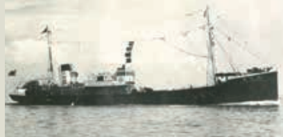
ディーゼルエンジンを備えた釧路丸

現在、フィッシュソーセージ、冷凍食品、缶詰などを生産し、サケやブリなど養殖を手掛けるとともに、青魚の油を使った医薬品原料なども生産しています。