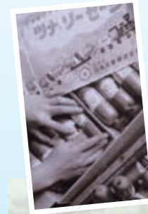
⑤ フィッシュソーセージの箱詰め作業