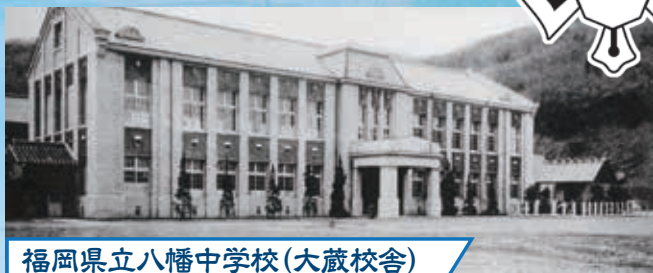
福岡県立八幡中学校(大蔵校舎)