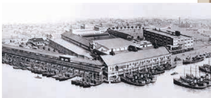
② 戸畑港は、漁業・製氷、冷凍、冷蔵、加工、流通、販売のすべての機能を集めた総合漁港となりました。

ニッスイ戸畑ビルは、1936年竣工でトロール漁業の司令部的機能を集約した当時としては近代的なビルディング。また珍しかったエレベーターも設置されました。5階には戸畑漁業無線局が置かれ屋上の無線鉄塔を通じて、世界の海で活動するトロール漁船と日夜分かたず交信していました。現在はニッスイパイオニア館の他、ニッスイマリン工業や関連の企業が入居しています。