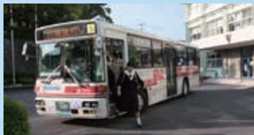
校内にバスが乗り入れる