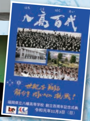
100周年記念ポスター