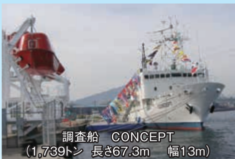
調査船 CONCEPT (1,739トン 長さ67.3m 幅13m)