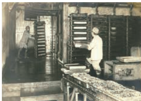
③ 戸畑冷蔵での食品の凍結の様子