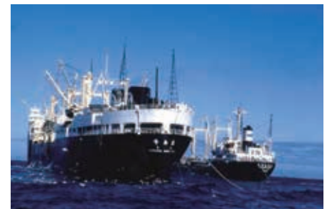
⑥ ベーリング海で活躍したすりみ母船峰島丸