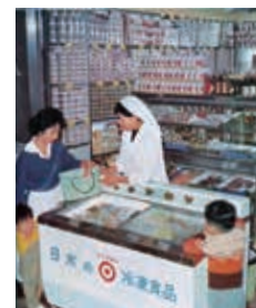
⑧ 1960(昭和35)年頃の冷凍食品の販売風景