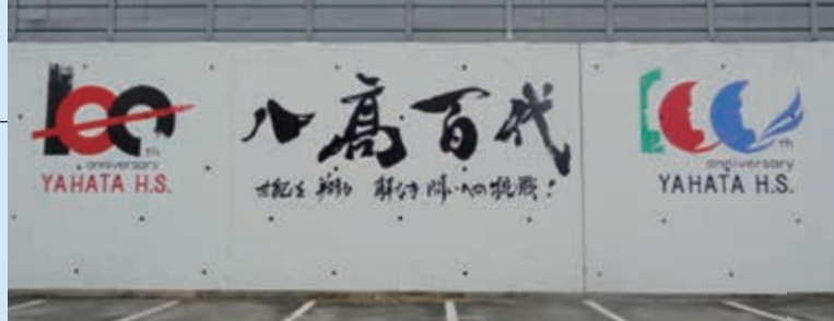
文化祭特別優秀賞