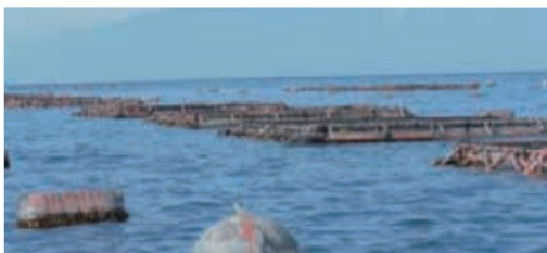
ブリの養殖黒瀬水産(宮崎)