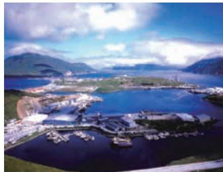
⑨ アメリカのアラスカ州に新しく作った、すりみ工場