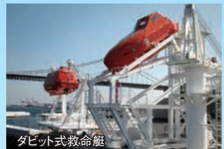
ダビット式救命艇

乗艇、進水、操船、各種備品の説明などを、実際に救命艇に乗艇して行う訓練を提供しています。