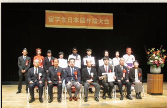
審査員として法人会より日向社会貢献委員長参加