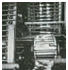
⑦ 冷凍すりみを使ってちくわを生産し、日本全国で販売しました