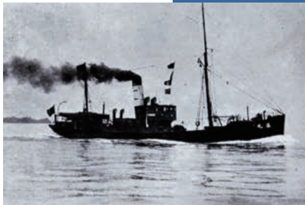
① トロール船「湊丸」(188トン 長さ 33.54m 幅6.4m)