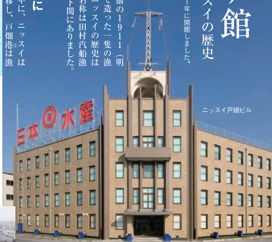
ニッスイ戸畑ビル

太平洋戦争が終わり、日本水産の社名となり再び遠洋漁業 ④ ができることになりました。獲った魚を使って、1952(昭和27)年から戸畑で本格的にフィッシュソーセージ ⑤ の生産を始めました。