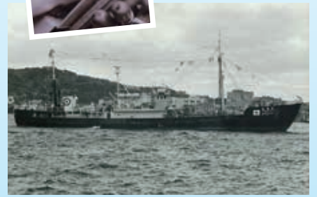
▲④ 戦後初めてサケ・マス漁を行った天龍丸