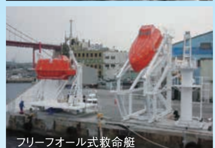
フリーフォール式救命艇