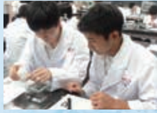
理数科 放射線セミナー