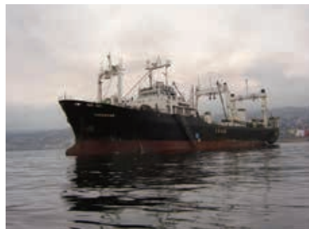
チリで操業を行ったユニオンスール号