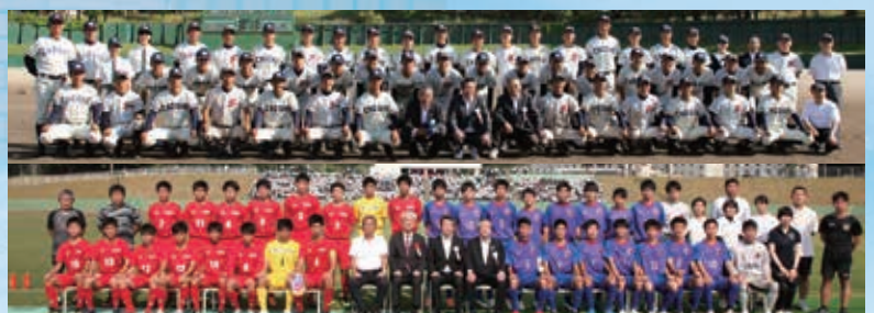
(上) 野球部 (下) サッカー部