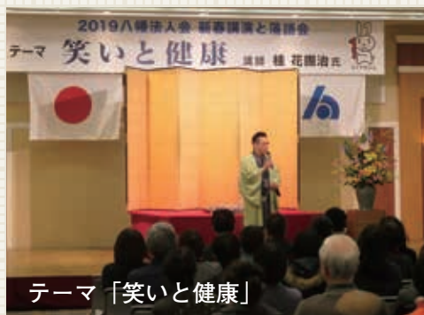
テーマ「笑いと健康」