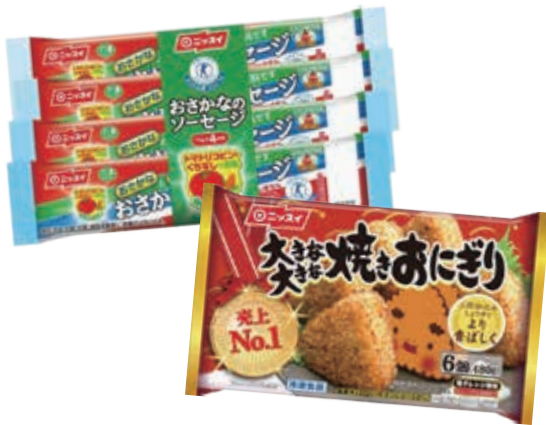
戸畑地区の工場で作っている商品「おさかなのソーセージ」と「大きな大きな焼きおにぎり」